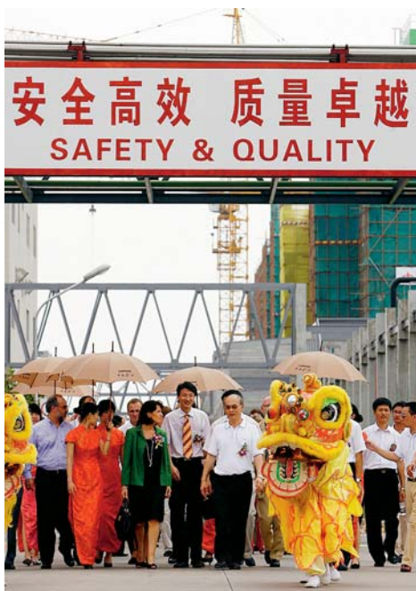
Bundesrätin Doris Leuthard (Mitte) öffnet der Schweizer Wirtschaft in China die Türen.