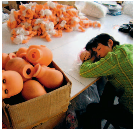
Sozialklauseln in Handelsverträgen bringen in der informellen Wirtschaft kaum Verbesserungen.

Heute taucht die Diskussion über die Sozialklausel im Rahmen der bilateralen Freihandelsabkommen wieder auf. In der