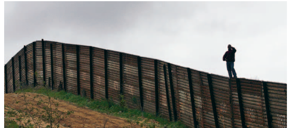
Industrieländer fordern von Entwicklungsländern die Beseitigung von Grenzen für Waren- und Finanzströme – für Menschen bleiben die Grenzen bestehen.

Seit Beginn der Neunzigerjahre haben die EFTA-Länder (Schweiz, Liechtenstein, Norwegen und Island) mehr als 16 bilaterale Freihandelsabkommen unterzeichnet. Die ersten Übereinkommen waren auf den freien Warenverkehr ausgerichtet, mit dem Ziel, die Handelsbeziehungen mit den Ländern des Mittelmeerbeckens zu sichern (Mazedonien, Kroatien, Türkei, palästinensische Gebiete, Marokko, Jordanien, Tunesien, Libanon, Ägypten). Später wurden viel weiter reichende Abkommen, die die Dienstleistungen, die Investitionen, das öffentliche Beschaffungswesen und das geistige Eigentum einbezogen, mit weiter ent-