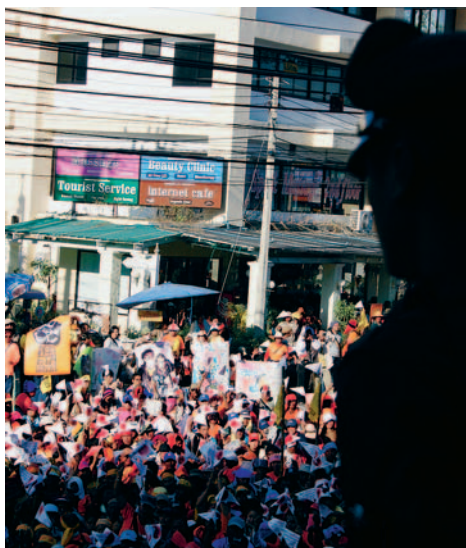
Die Bevölkerung Thailands demonstriert gegen bilaterale Freihandelsabkommen.

menstext, der lediglich von Repräsentanten der Handelskammer eingesehen werden konnte, nicht berücksichtigt wurden. Im Februar 2007 erzwang eine Massendemonstration die Entscheidung des nationalen Wahlgerichts, eine Volksabstimmung durchzuführen. Die Gegner des Freihandelsabkommens befürchteten nämlich, dass Costa Rica durch die Öffnung der Grenze mit Waren aus den USA überschwemmt würde und dass Tausende Arbeitsplätze verloren gingen. Der Wahlkampf war für die GegnerInnen jedoch schwierig zu bestehen, denn die Medien berichteten lediglich über angebliche Vorteile eines Abkommens. Das Gericht verbot Universitäten, im Abstimmungskampf tätig zu werden, da dies einem Missbrauch von Steuergeldern gleichkommen würde. Umgekehrt widmeten der Präsident Oscar Arias und seine Minister dem Wahlkampf sehr viel Zeit und köderten das Volk mit unlauteren Mitteln: «Wir machen