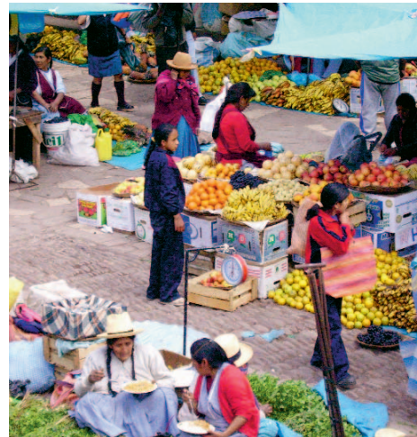
Bäuerinnen können wegen billiger Importe ihre lokalen Produkte nicht mehr verkaufen.

Die bilateralen Abkommen widerspiegeln häufig eine Diplomatie, in der sich die besonderen Verbindungen zweier Länder ausdrücken. Die Verhandlungen beginnen häufig im Anschluss an eine Staatsvisite und werden im Geheimen, ohne kritische Öffentlichkeit, fortgesetzt. Ein solcher Verhandlungsrahmen erschwert es, gegen ein ungleiches Kräfteverhältnis vorzugehen. Der Rhythmus ist so angesetzt, dass die Parlamente und die Zivilgesellschaft die Verhandlungen nicht sorgfältig begleiten können. Die demokratische Glaubwürdigkeit des gesamten Prozesses leidet darunter.