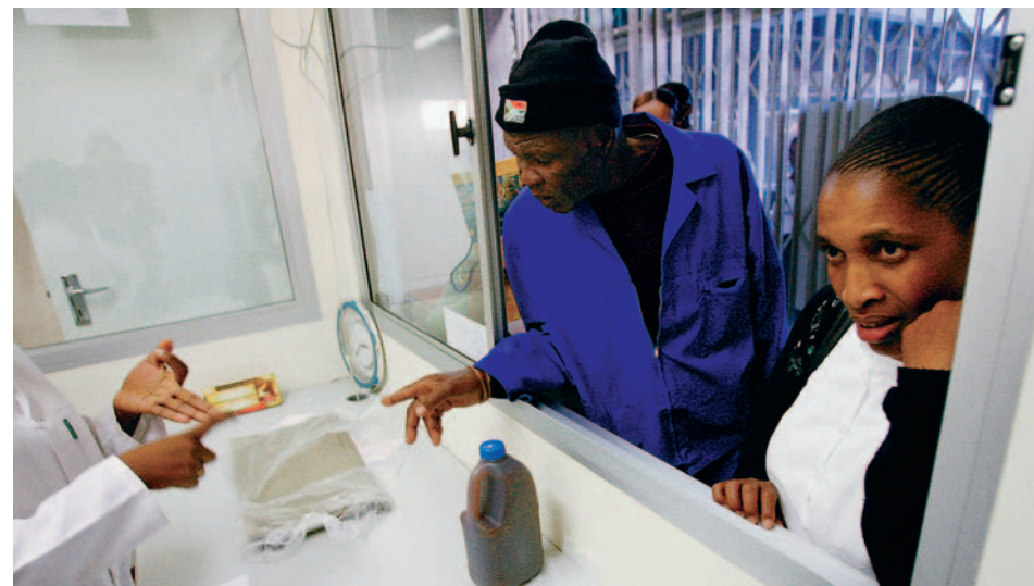
Für die ärmere Bevölkerung sind billige Medikamente überlebenswichtig.

Die Forderung nach Beitritt zum UPOV-Abkommen hat zur Folge, dass die Partnerländer die neueste Version von 1991 unterzeichnen müssen – und dies, obwohl die Schweiz erst letztes Jahr entschieden hat, diese Version zu ratifizieren und Norwegen