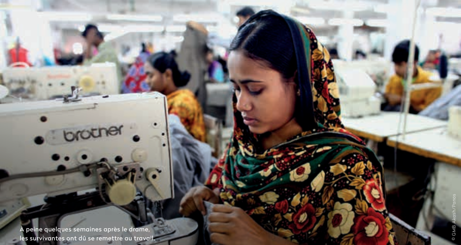
À peine quelques semaines après le drame, les survivantes ont dû se remettre au travail.