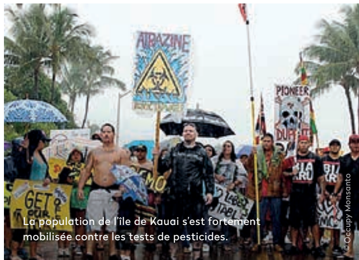
La population de l'île de Kauai s'est fortement mobilisée contre les tests de pesticides.

Hawaï. Syngenta est même parvenue à placer deux de ses anciens employés au conseil de Kauai et au comité chargé de la surveillance de la qualité de l'eau sur l'île.