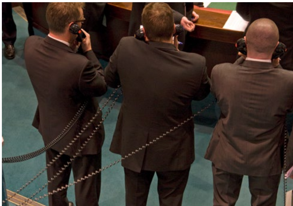
Rohstoffhändler in London. Insiderwissen zahlt sich bei Spekulationen aus.

Das Fehlen letzter wissenschaftlicher Beweise für den Einfluss exzessiver Finanzspekulation auf die Nahrungsmittelpreise ist kein Grund für politische Untätigkeit. Angezeigt ist vielmehr die Anwendung des Vorsorgeprinzips. Dies gilt auch für die Agrarhändler, deren Rolle im Rohstoff-Casino weitgehend im Dunkeln liegt. Klärung tut hier für die Rohstoffhandelsdrehscheibe Schweiz speziell not.